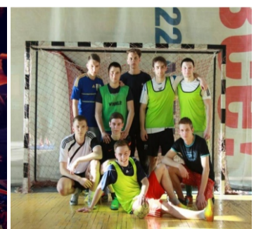
Победители спортивных соревнований

Наши контакты: г. Донецк, ул. Артема, 96, ауд. 3.101а. Тел.: +38 (062) 337 57 68, +38 (095) 066 85 00, +38 (071) 309 81 09