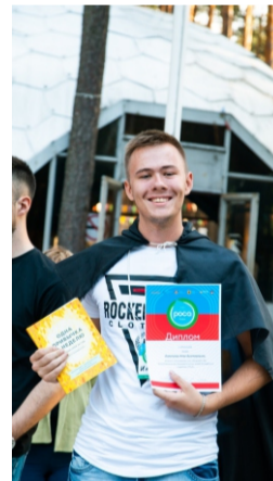
Студент ИЭФ в Международном образовательном лагере «Роса». Рязань, 2018 г.