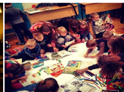
Посещение студентами детского дома