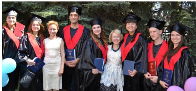
Вручение магистрам дипломов РФ, 2018 г.