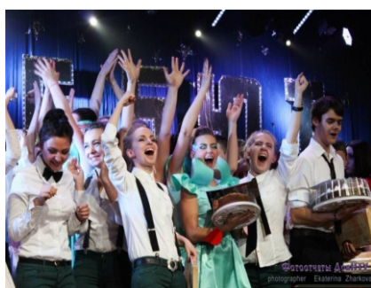
Победа студентов ИЭФ на дебюте первокурсника