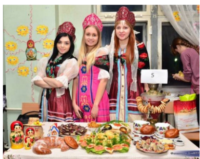
Празднование масленицы в 5-м общежитии