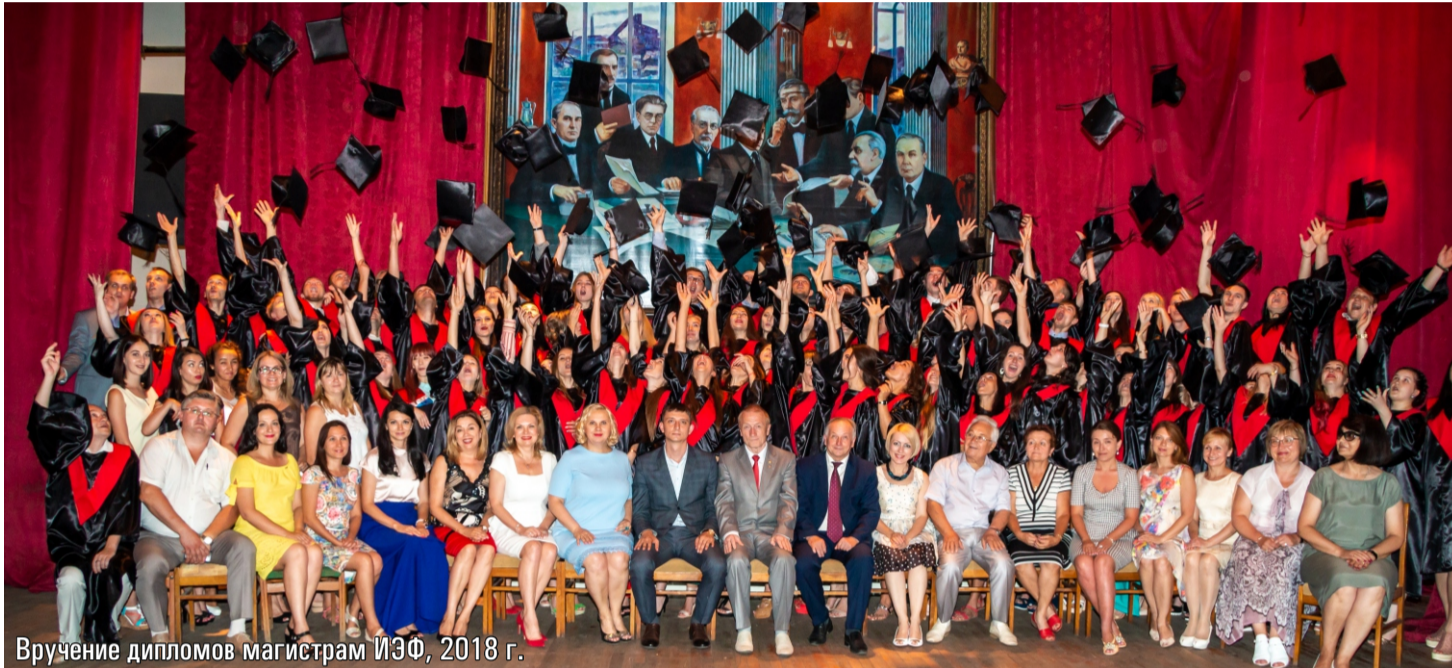
Вручение дипломов магистрам ИЭФ, 2018 г.