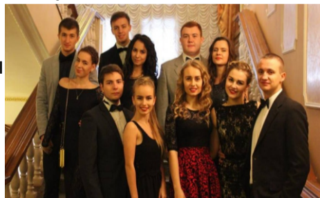
Студенческая церемония награждения премией «За дело»