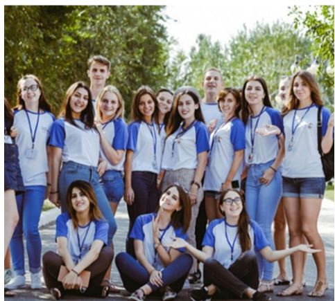
Студентки-бухгалтера на Международном молодежном форуме «СЕЛИАС», Астраханская обл., 2017 г.